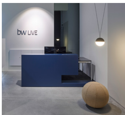
Die großen Tische sind schon gar kein Arbeitsplatz mehr, sondern eine Arbeitsinsel.